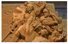
★砂の美術館(第9期南米編)

世界初「砂の彫刻」を展示する美術館を楽しんだ後は、東西16km、南北2.4kmに広がる日本最大級の鳥取大砂丘。大自然の織りなす造形美をご体感してください。お土産は「砂丘会館」でお買い求めいただけます。