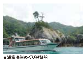
★浦富海岸めぐり遊覧船

「山陰ジオパーク」を めぐるコースです。 貴重な地質や地形を お楽しみください。