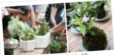
★苔玉づくり体験&完成した苔玉(イメージ)